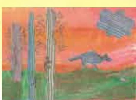
Immagine realizzate dai ragazzi durante i laboratori