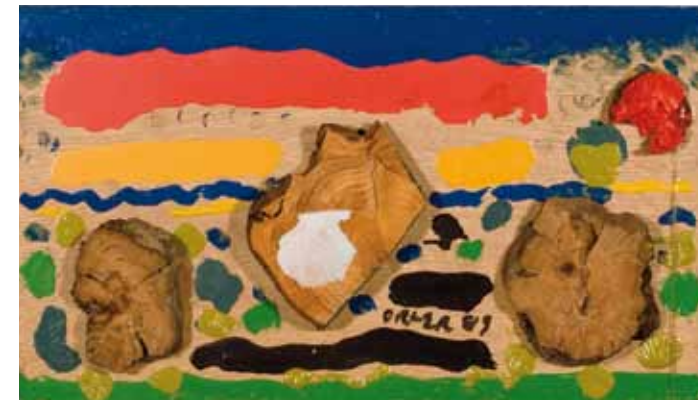
Composizione di un paesaggio, 1989 legno e smalti su tavola 26 x 45 cm