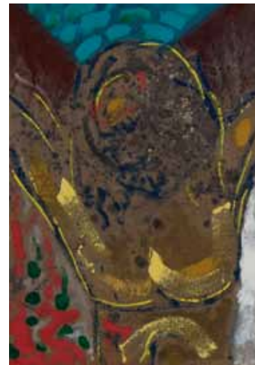
Ecce Homo, 1999 smalti ed olio su faesite 64 x 45 cm