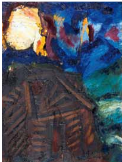
Baita e luna, 1964 olio su faesite 39,5 x 30 cm